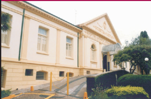
Santa Casa de Misericórdia

Atendimento de urgência em dois endereços, comodidade que só a Uniodonto oferece.